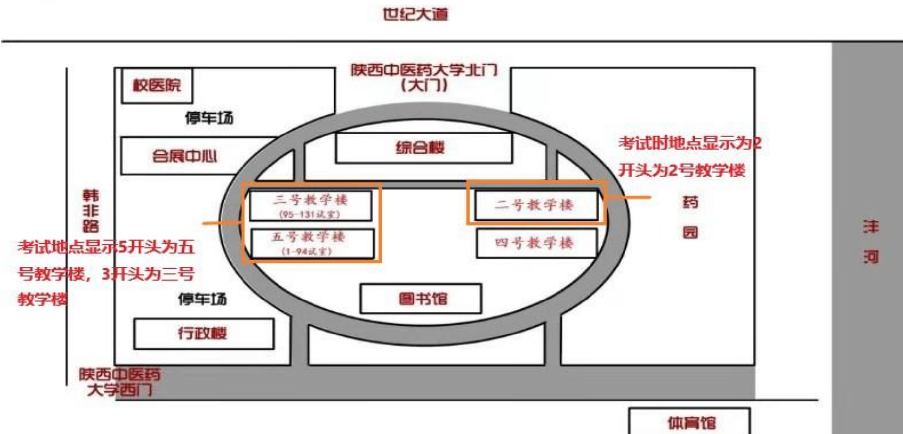
陕西中医药大学考试地点说明图