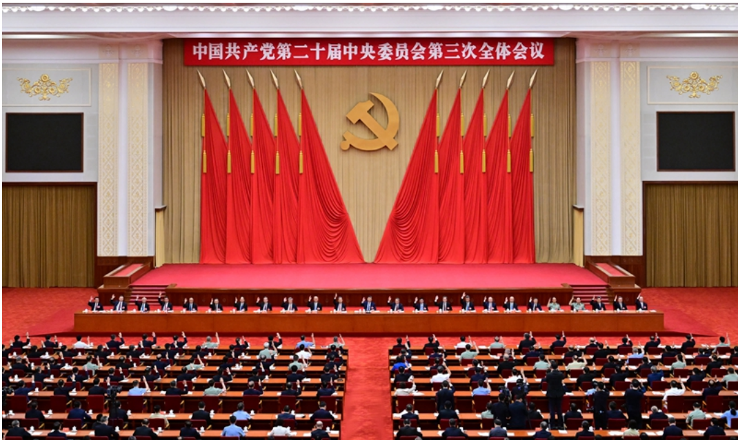
中国共产党第二十届中央委员会第三次全体会议，于2024年7月15日至18日在北京举行。

全会强调，中国式现代化是走和平发展道路的现代化。必须坚定奉行独立自主的和平外交政策，推动构建人类命运共同体，践行全人类共同价值，落实全球发展倡议、全球安全倡议、全球文明倡议，倡导平等有序的世界多极化、普惠包容的经济全球化，深化外事工作机制改革，参与引领全球治理体系改革和建设，坚定维护国家主权、安全、发展利益。