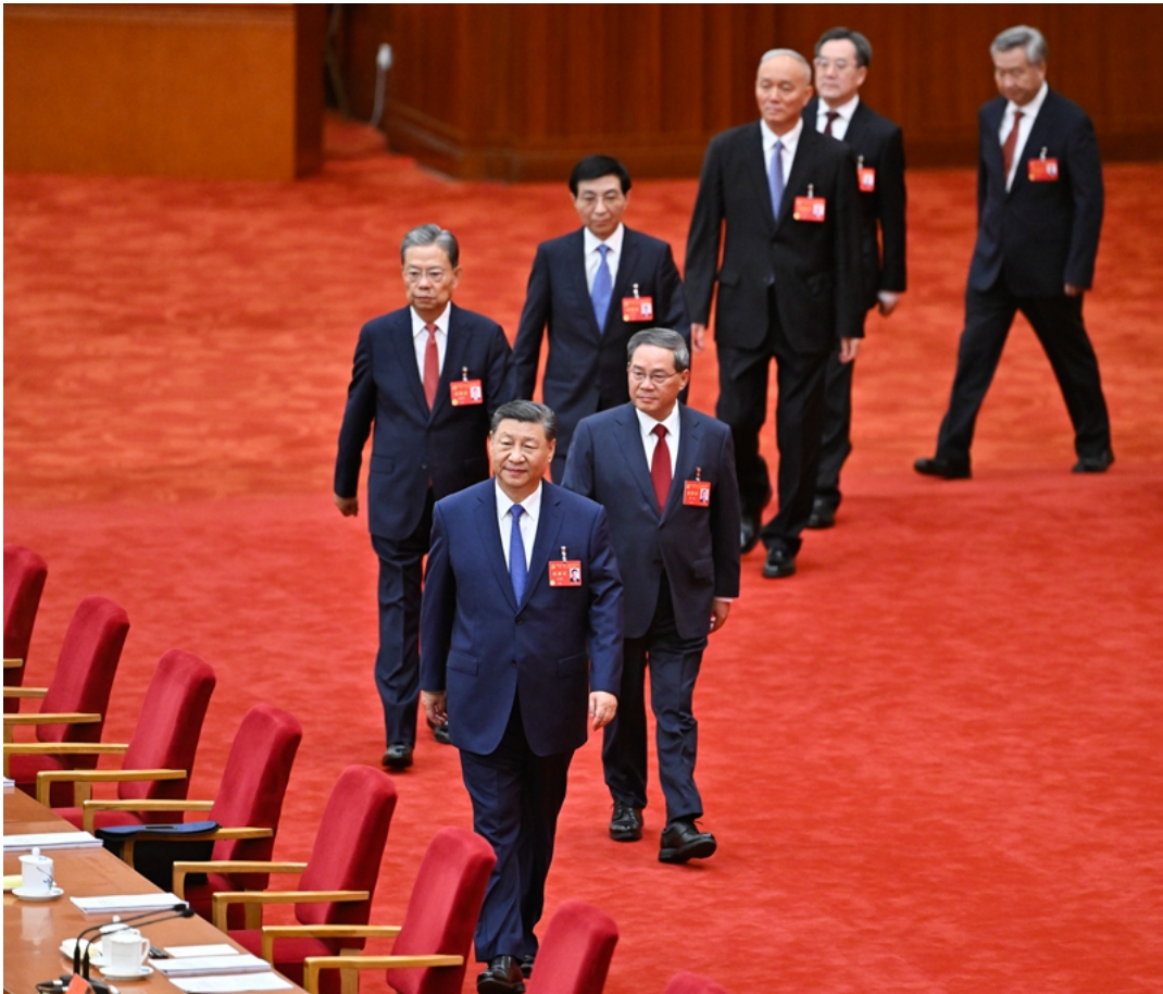
中国共产党第二十届中央委员会第三次全体会议，于2024年7月15日至18日在北京举行。这是习近平、李强、赵乐际、王沪宁、蔡奇、丁薛祥、李希等步入会场。

全会听取和讨论了习近平受中央政治局委托所作的工作报告，审议通过了《中共中央关于进一步全面深化改革、推进中国式现代化的决定》。习近平就《决定（讨论稿）》向全会作了说明。