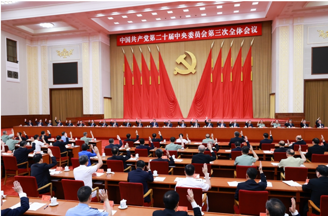
中国共产党第二十届中央委员会第三次全体会议，于2024年7月15日至18日在北京举行。中央政治局主持会议。

全会强调，进一步全面深化改革，必须坚持马克思列宁主义、毛泽东思想、邓小平理论、“三个代表”重要思想、科学发展观，全面贯彻习近平新时代中国特色社会主义思想，深入学习贯彻习近平总书记关于全面深化改革的一系列新思想、新观点、新论断，完整准确全面贯彻新发展理念，坚持稳中求进工作总基调，坚持解放思想、实事求是、与时俱进、求真务实，进一步解放和发展社会生产力、激发和增强社会活力，统筹国内国际两个大局，统筹推进“五位一体”总体布局，协调推进“四个全面”战略布局，以经济体制改革为牵引，以促进社会公平正义、增进人民福祉为出发点和落脚点，更加注重系统集成，更加注重突出重点，更加注重改革实效，推动生产关系和生产力、上层建筑和经济基础、国家治理和社会发展更好相适应，为中国式现代化提供强大动力和制度保障。