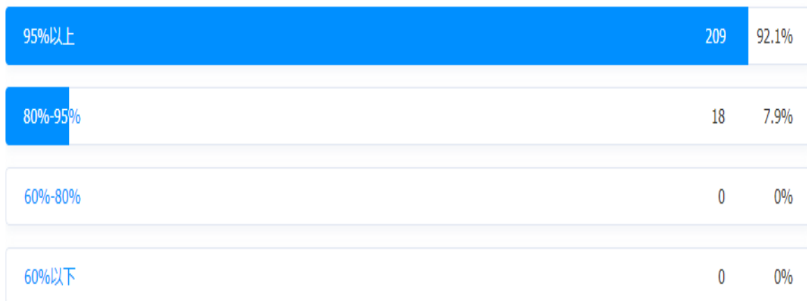
图 2 学生所在班级出勤率情况