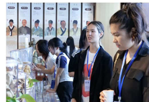
Участие учащихся в социально-практическом мероприятии «Почувствовать Китай — войти в горы Циньлин, раскрыть тайны китайской фитотерапии»