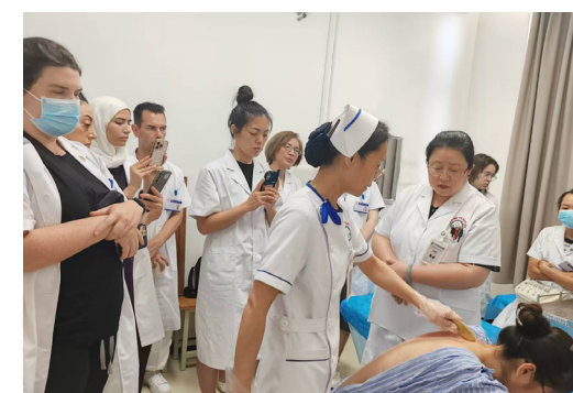
Изучение канадскими учащимися метода лечения гуаша — характерной терапии традиционной китайской медицины

Руководство по приему иностранных студентов