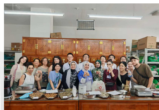
Знакомство участников международной летней школы с идентификацией сырья китайской фитотерапии