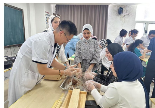
Освоение технологии изготовления медовых пилюль китайской фитотерапии египетскими учащимися